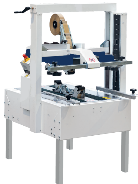
Standardversion av CT 303 TB