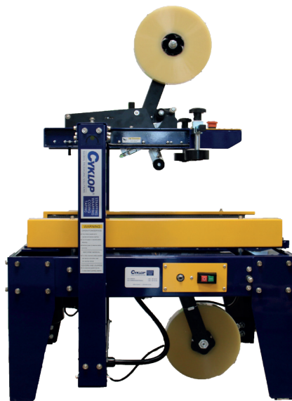
Standardversion av CT 102 SD

< Klicka här för att se en video på CT 102 SD >